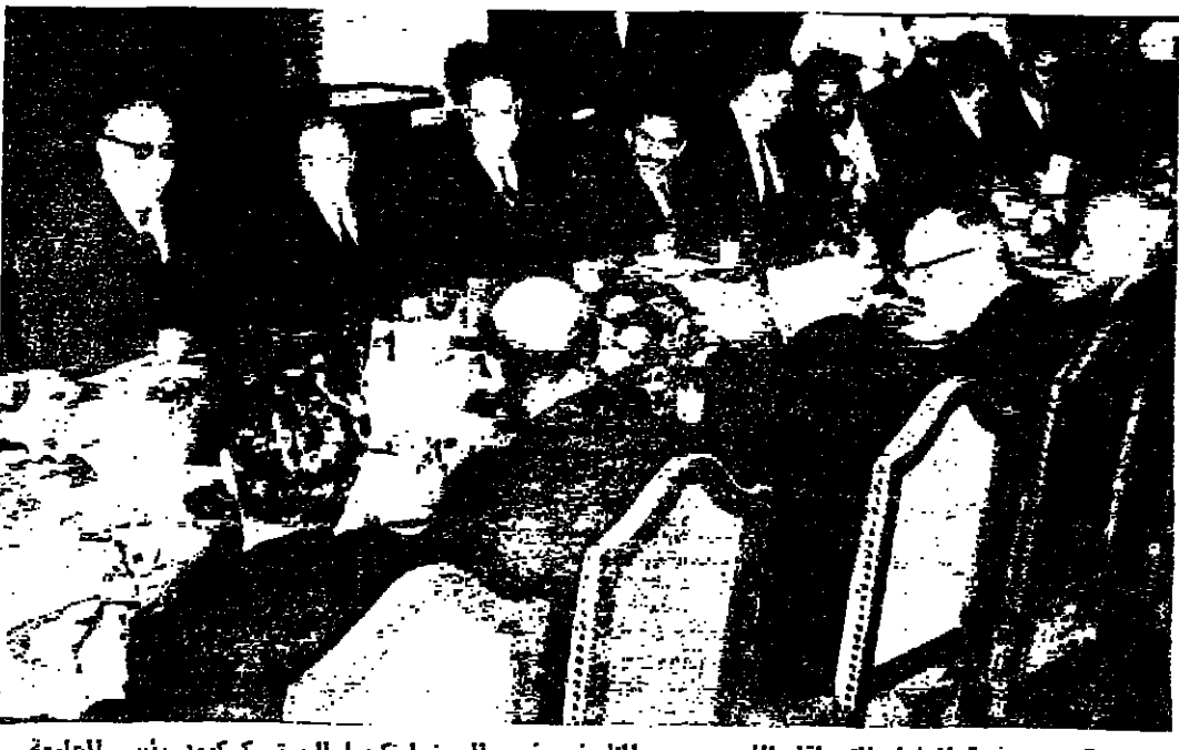
جانب من مائدة المشاء التي اقامها السيد بهجت الطهوني رئيس الوزراء الكويتي للمستر كركوود رئيس الجامعة الامريكية في بيروت

نيوكاسل «اتكلرا» - رويتر - انهم المستر دوغلاس جاي وزير التجارة البريطانية السابق فرنسا بتقدير ازمة الذهب العالمية لتخفيض الإنكسوا ساكسون الكروهنين . رأي في الإسباب وبلغ المستر جاي وهو عضو عمالي في البرلمان اجتماعاً سياسياً هنا ان الشعب البريطاني قد مل من رؤية السياسة البريطانية واقعة تحت سيطرة الفرنسيين وقال ان أزمة الذهب العالمية نشأت الى حد كبير بسبب جهود الفرنسيين البقية على الصفحة الرابعة عمود ٢